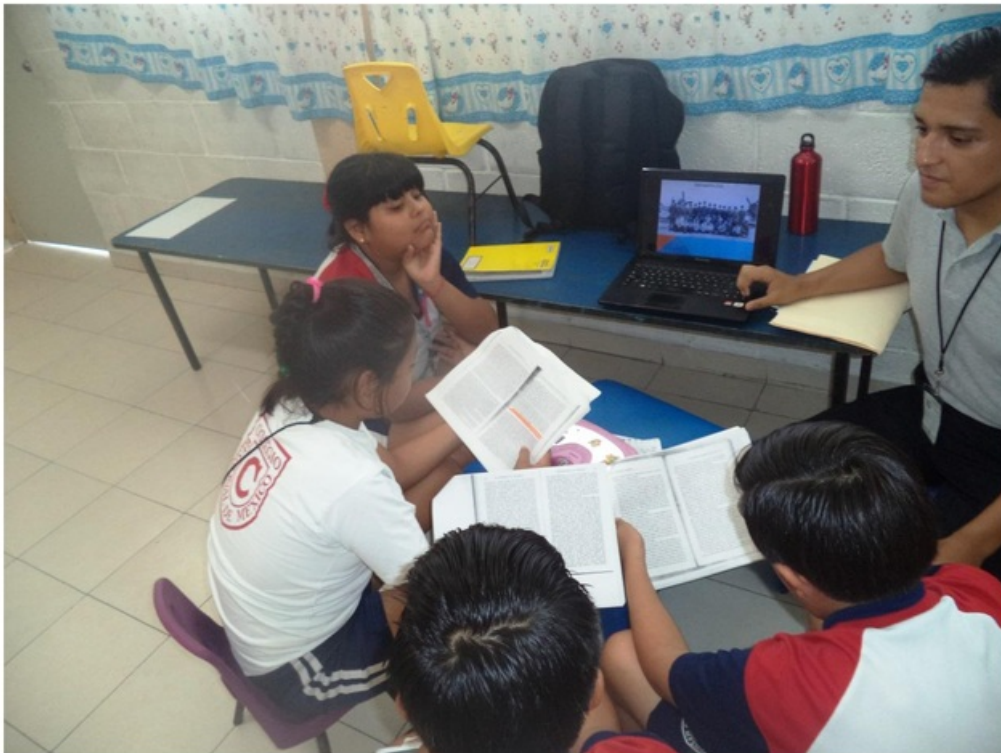
Explicando a los alumnos las importancia del Escuadrón Aéreo 201 en la parte más álgida del conflicto.