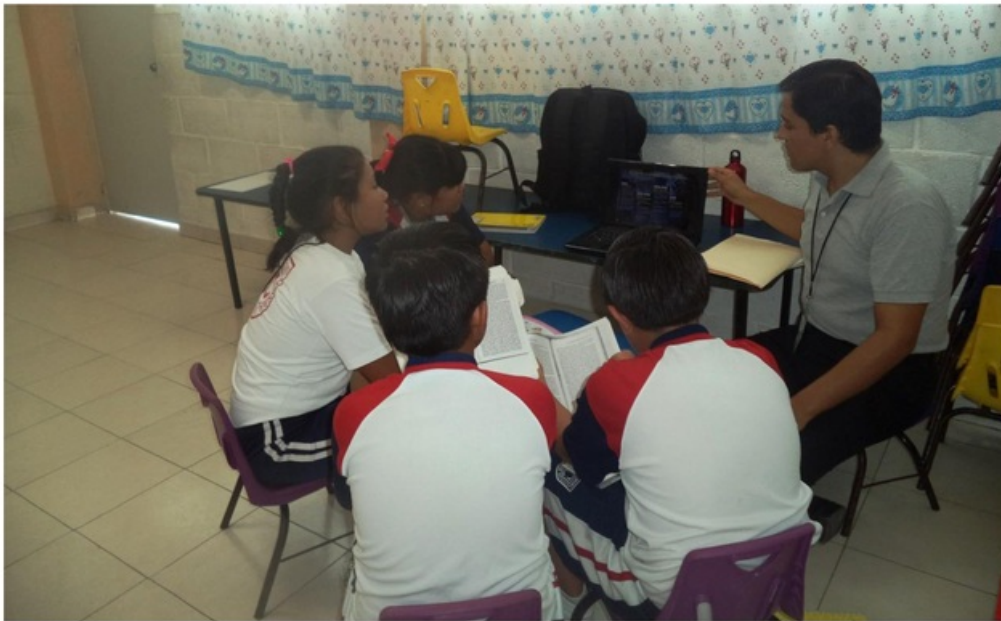
Explicando a los alumnos las causas del ingreso de México al conflicto bélico internacional.