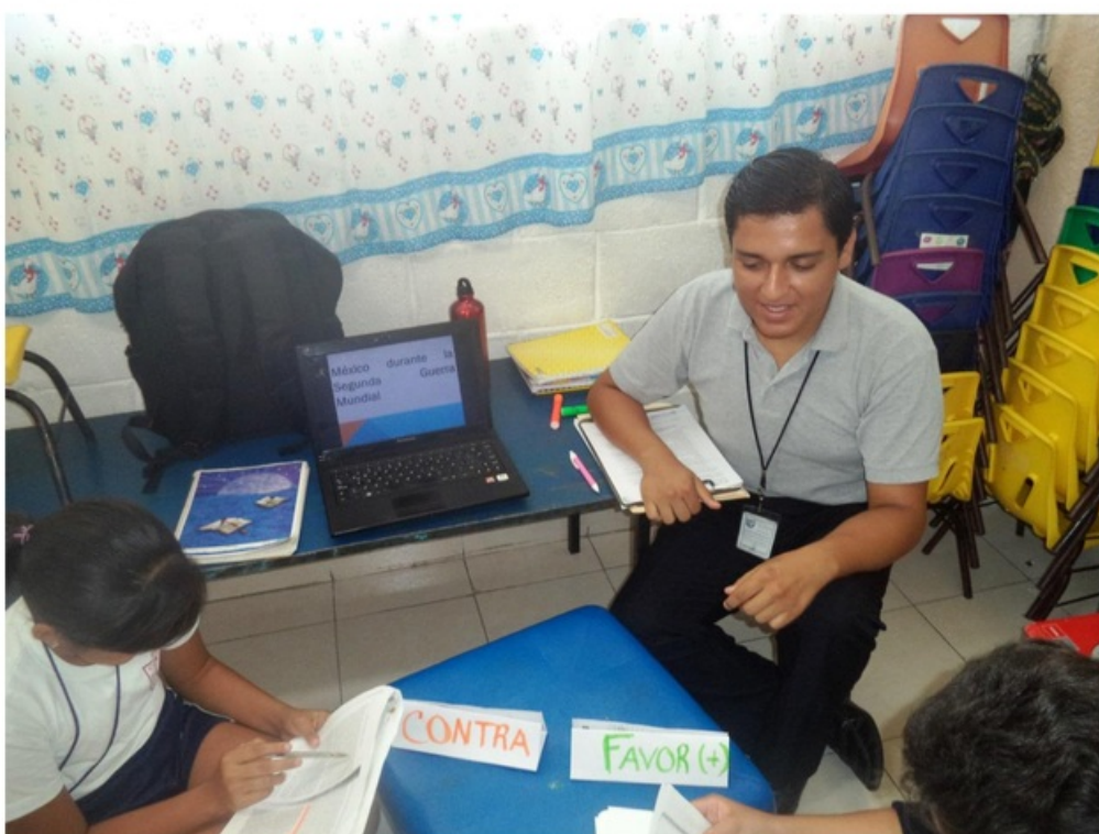
Intervención de cada punto de vista, los compañeros atentos de sus argumentos.