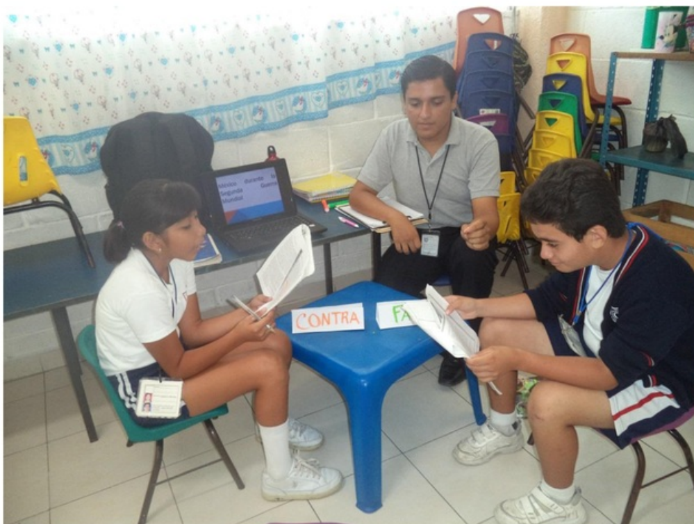
Los alumnos construyen su intervención para el debate, forma en la que se evaluó el tema.