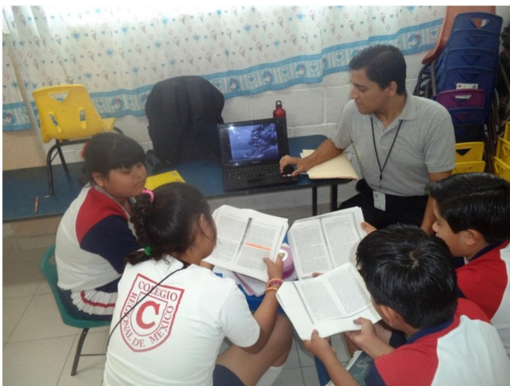
Enseñando a los alumnos imágenes de los barcos 'Petrolero del Llano' y el 'Faja de Oro' que fueron hundidos por los nazis y significaron el ingreso de nuestro país al conflicto.