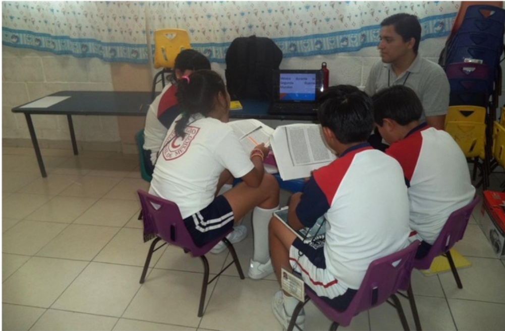
Breve introducción explicando las causas que detonaron la Segunda Guerra Mundial en Europa.